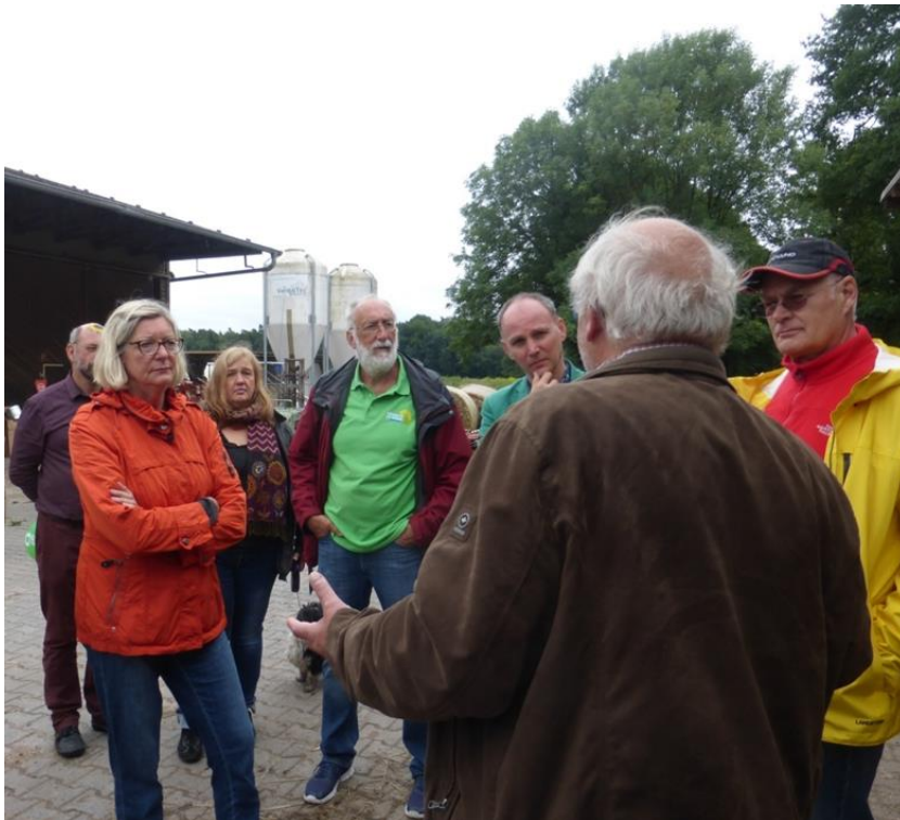
Informationen über nachhaltige Landwirtschaft. Unter den Zuhörern MdB Wolfgang Strengmann-Kuhn (3. v. r.)

Unter den riesigen Bäumen am Hofgut Patershausen trafen sich die Grünen aus Heusenstamm, Dietzenbach und Obertshausen und - aufgrund des schlechten Wetters mit nur einigen Gästen - zum Kennenlernen, zur Unterhaltung, zum Spielen, zum Essen und zur Information über nachhaltige Landwirtschaft und aktuelle politische Themen.