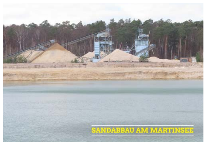
SANDABBAU AM MARTINSEE

Und so ging es auch weiter. 2007 war die Zahl der Mitarbeiter auf rund 200 gesunken und Braas verwendete nur noch 20% des abgebauten Sandes hier im Werk. (Fortsetzung auf Seite 2)